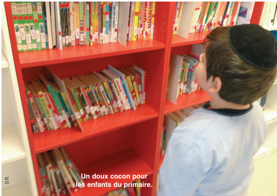
Un doux cocon pour les enfants du primaire.

Ils savent le temps limité, mais là, dans le calme du lieu, ils sont libres. Ethan se rend